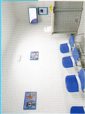
Reception e Studi medici